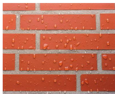
0602 TM-08 13 EW_JEn_Ke