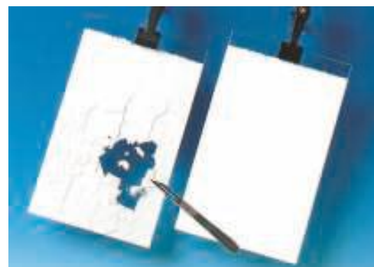
На Foto 1 и Foto 2: образец слева: обычная дисперсионная краска образец справа: Amphibolin.